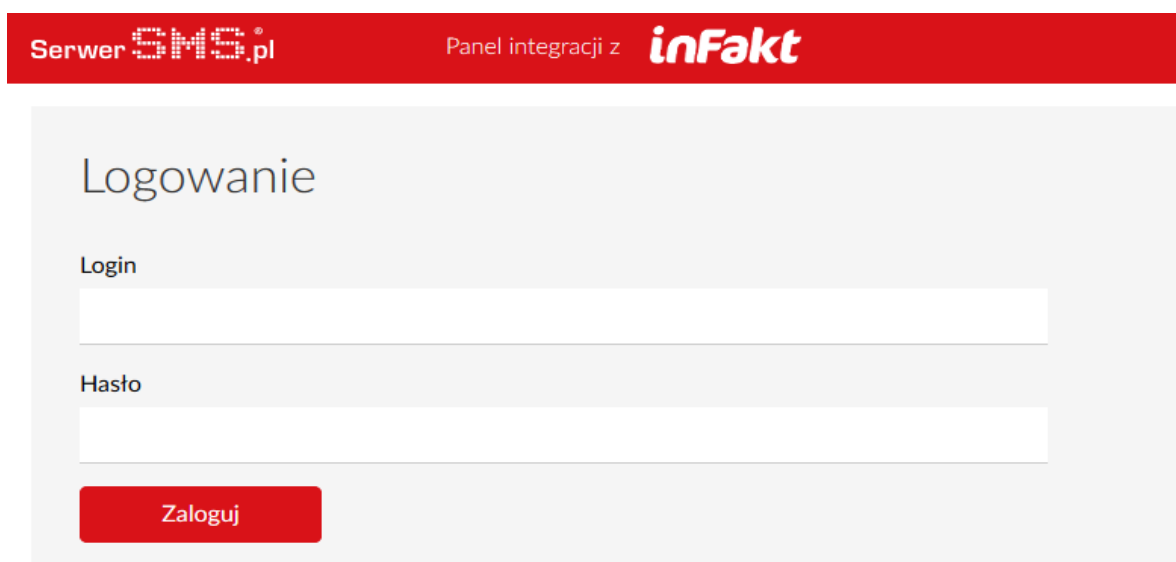
Rys. 1 – Formularz logowania

Pierwszym etapem instalacji modułu jest autoryzacja w SerwerSMS.pl. pod adresem URL https://infakt.serwersms.pl . Korzystanie z integracji możliwe jest po aktywacji konta w panelu SerwerSMS.pl. Warto zaznaczyć, aby posługiwać się osobnym użytkownikiem API, którego można stworzyć w panelu SerwerSMS.pl → Ustawienia interfejsów → XTTPS XML API → Użytkownicy API.