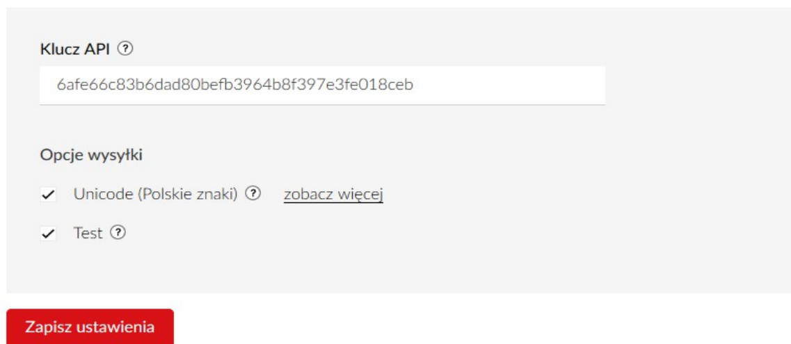
Rys. 3 – Konfiguracja ustawień